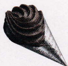
Cornet argent Gianduja et chocolat noir 70%