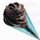
Cornet bleu Gianduja croustillant