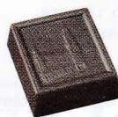
Bruxelles noir Ganache onctueuse de chocolat noir